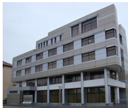
Sediu AFP Urziceni