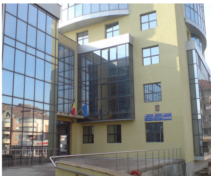
Sediu AFP Slobozia